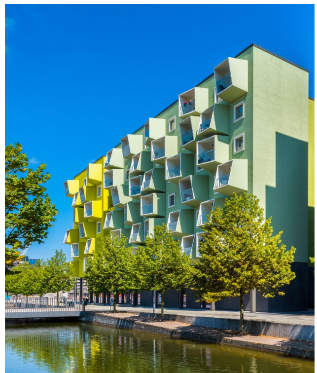
Bild 10. Westfassade des Ørestad Plejecenters in Richtung Kanal