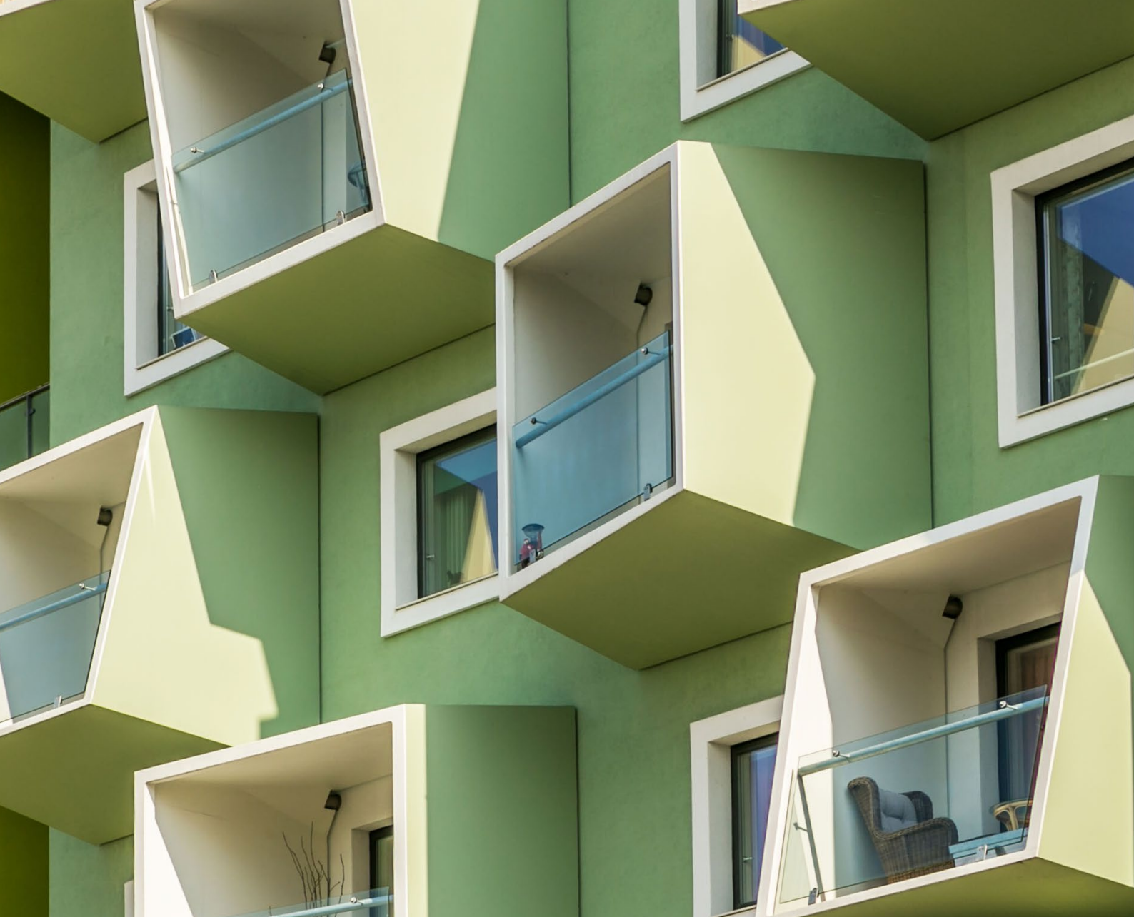
Bild 1. Das Versionslogo der mb WorkSuite 2025: Ørestad Plejecenter