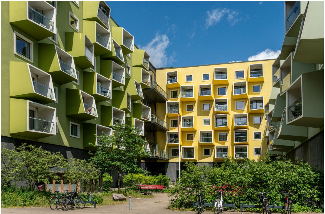
Bild 9. Privater Innenhof als Rückzugsort