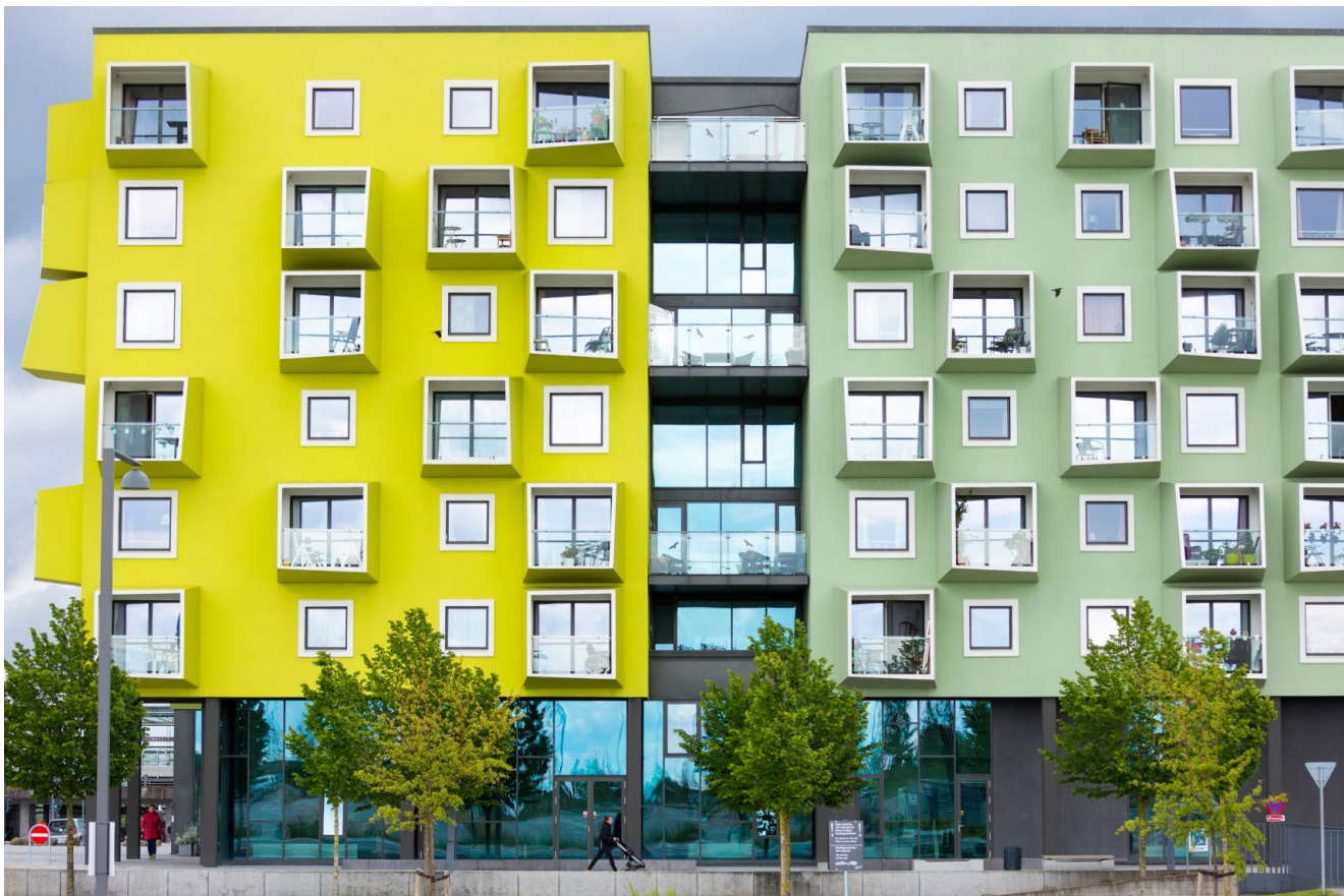
Bild 8. Die 5 Meter hohe Glasfassade im EG lädt das öffentliche Leben ein.