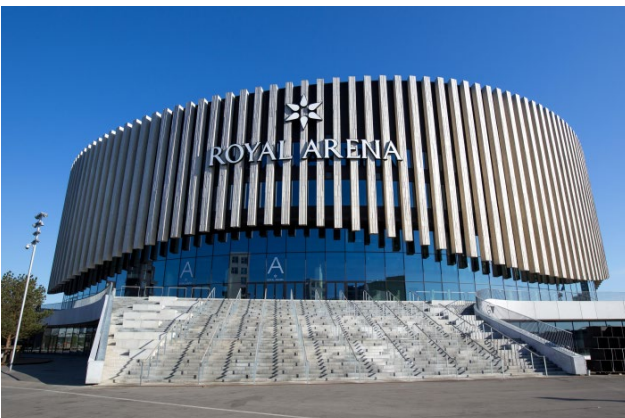
Bild 3. Royal Arena: Mehrzweckhalle für Sportveranstaltungen und Konzerte