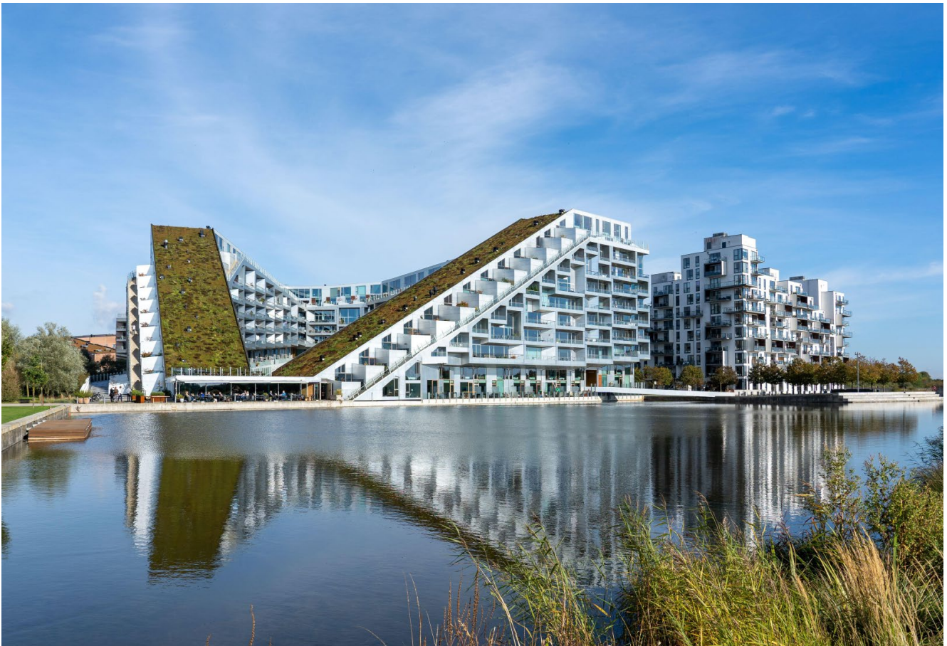
Bild 6. 8 House, auch Big House genannt: Wohngebäude in Form einer Acht mit großem begrüntem Dach