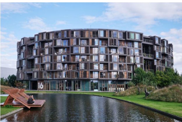
Bild 5. Tietgenkollegiet, ein architektonisch wegweisendes Studentenwohnheim: Das kreisförmige Gebäude verfügt über 360 Zimmer.

Ørestad liegt auf Amager, einer Insel vor Kopenhagen, die im Osten an den Öresund grenzt, die Meerenge zwischen Dänemark und Schweden, nach der der neue Stadtteil benannt ist. Als sich die Stadt Kopenhagen Ende der 80er Jahre für den Bau von Ørestad entschied, war sie hoch verschuldet und man hoffte, dass Ørestad die Hauptstadt beleben und in Zukunft ein Magnet für Unternehmen und Familien sein würde. Eine Rechnung, die aus heutiger Sicht sehr gut aufgegangen ist. Positive Impulse gehen vor allem von der sehr guten Lage zwischen Zentrum und Flughafen sowie einer hervorragenden Infrastruktur aus.